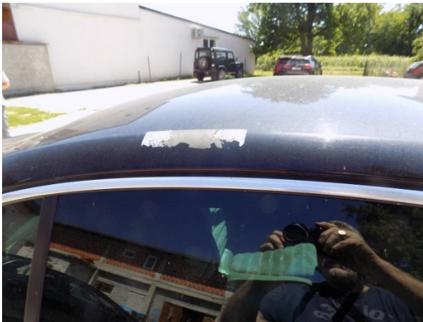
1. Volkswagen Passat - oštećenje krova