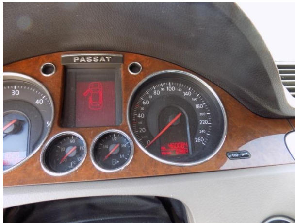
3. Volkswagen Passat – kilometar sat