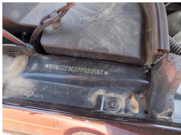
4. Volkswagen Passat – broj šasije