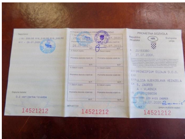
5. Volkswagen Passat – prometna dozvola