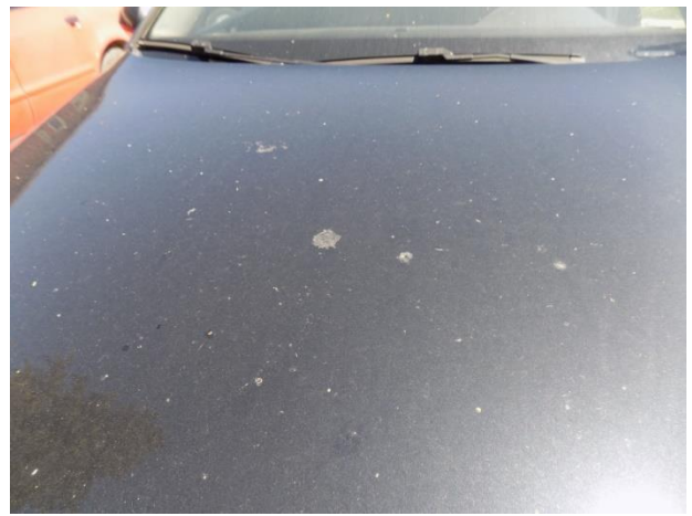
2. Volkswagen Passat – oštećenje poklopca motora